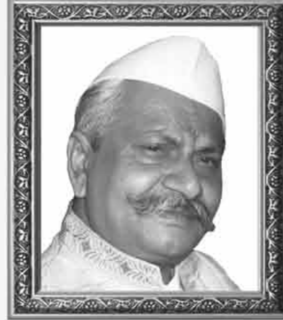
પિતાશ્રી ખીમજી રાજા ગડા ગામ : સામખીચારી